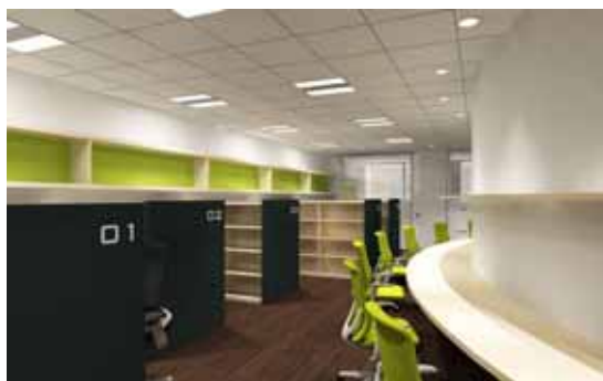
コラボレーションオフィス