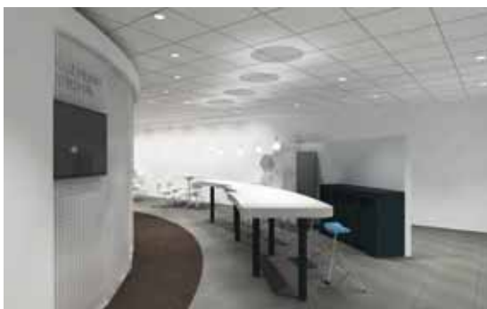
コネクティブキッチン