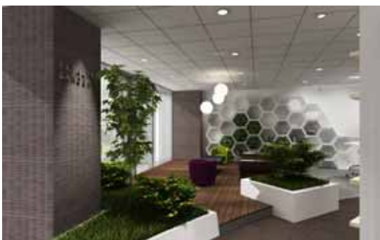
アウトドアサロン